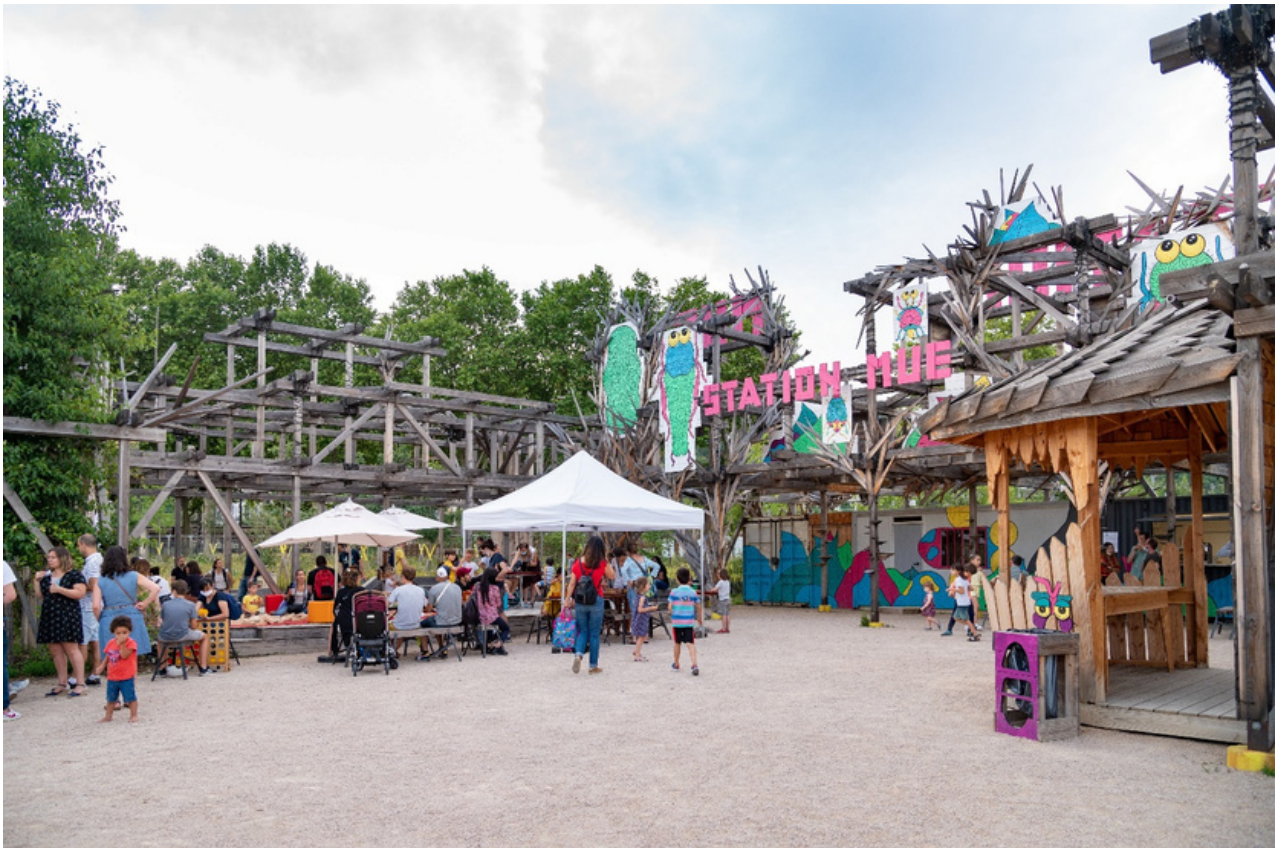
Photographie 1 - Fête de la musique des enfants (Laurence Danière, 2 juillet 2021)

La genèse de la Station Mue remonte à 2018, résultant de la collaboration entre la maîtrise d'œuvre BASE paysagiste et le collectif Bruit du Frigo. Cette initiative a émergé dans le contexte de la conception des espaces publics du projet du « Champ » sous l'impulsion de la SPL Lyon Confluence et s'est matérialisée en une création urbaine expérimentale située au sud de La Confluence (cf. photographie 1).